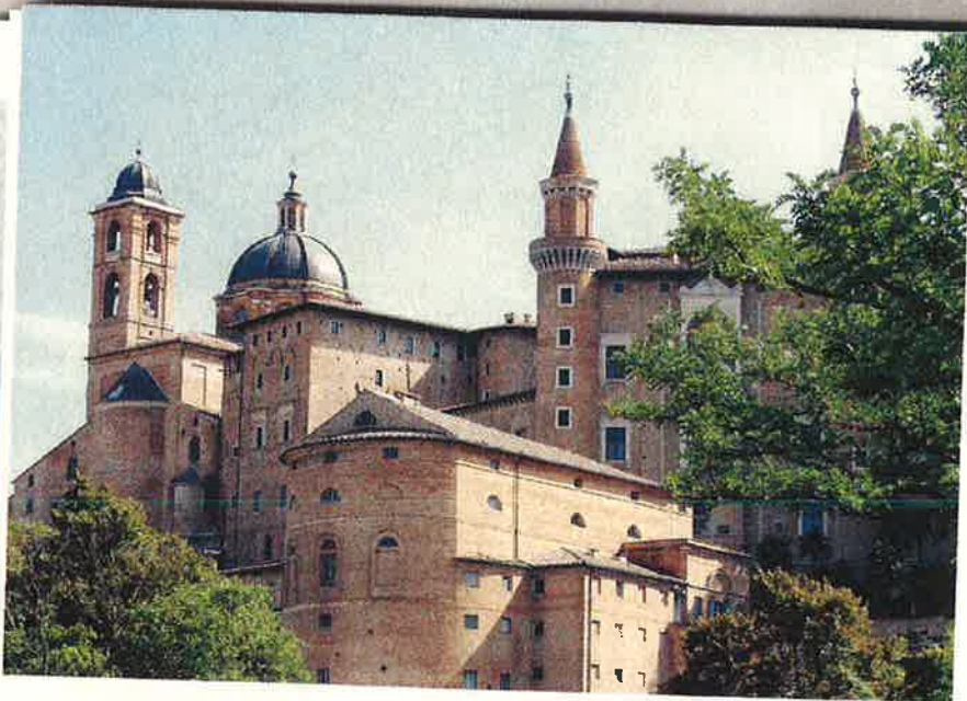
Het beste uitzicht op de contouren van het Palazzo Ducale in Urbino heb je net buiten de stad

plaveid plein met enkele terrassen, een fontein en twee romaanse kerken.