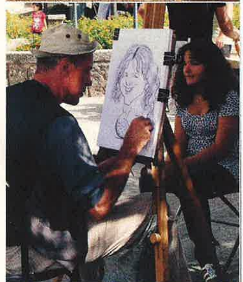
Boven: De rust van Borgo Belfiore Midden: Portret-tekenaar in San Marino Onder: Het San Michelestrand bij Sirolo