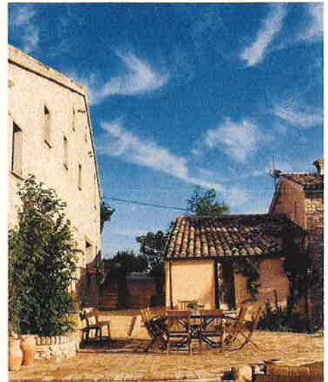
Grote foto: Montefortino is een prima uitvalsbasis voor wandelingen in de Monte Sibillini

die de grens met Umbrië markeren, vormt de stoere kant van De Marken. Je ziet de kale groene pieken op vele tientallen kilometers liggen, zelfs vanaf de kust. Hoogtepunt is Nationaal Park Monte Sibillini. Met zijn kloven, meertjes, toppen en hoogvlaktes leent het zich prima voor een dag bergwandelen zoals in de kloof de Gola di Infernaccio (circa vijf uur) vanuit Montefortino of naar het meer van Fiastra. Steek ook even de kam en de grens over naar de Piano Grande. Deze door bergen omringde hoogvlakte met het schilderachtig op een rots gelegen Castelluccio is een goed uitgangspunt voor wandelingen. Alternatieven voor bergwandelingen zijn de dichtbeboste regionale parken Monte Conero aan de kust en Gola della Rossa e Frasassi, waar Genga en Avacelli goede bases zijn. Het dunbevolkte noordwesten is ►